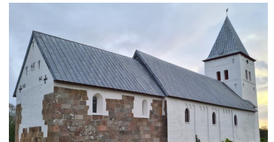
Darum Kirke , Sviegade 4B, Store Darum, 6740 Bramming

Peterh@FDF , senest 28.1. Tilmelding til generalforsamlingen til Peterh@FDF.dk , senest fredag den 23. februar 2024 af hensyn til traktementet.