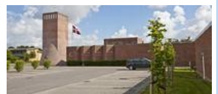
Sædden Kirke , Fyrvej 30, 6710 Esbjerg V.