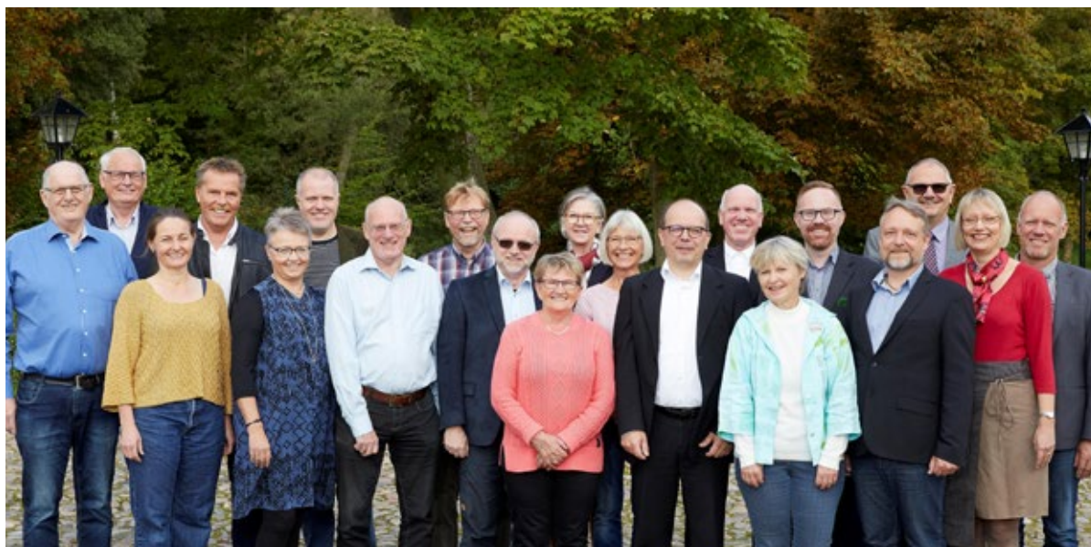
Bestyrelsen for Landsforeningen af Menighedsråd.