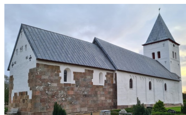
Darum Kirke , Sviegade 4B, Store Darum, 6740 Bramming