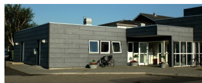
Darum Kultur- og Fritidscenter , Nørrebyvej 16, Darum, 6740 Bramminge