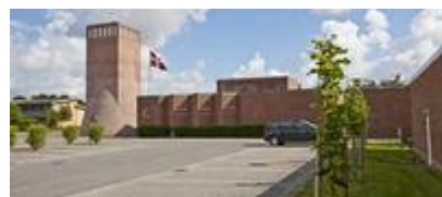
Sædden Kirke , Fyrvej 30, 6710 Esbjerg V.